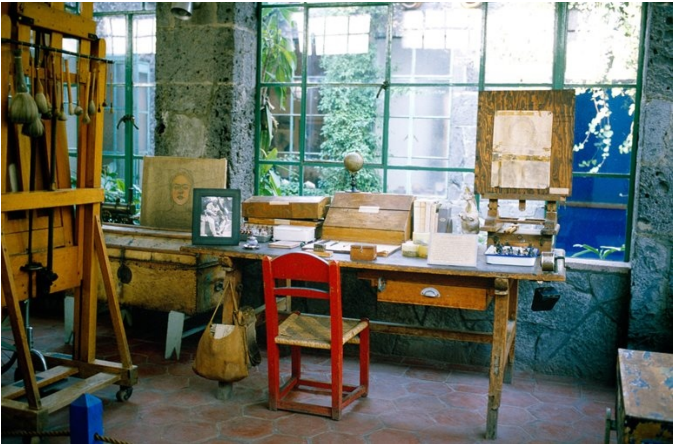
På opdagelse i Frida Kahlos hus i Mexico City