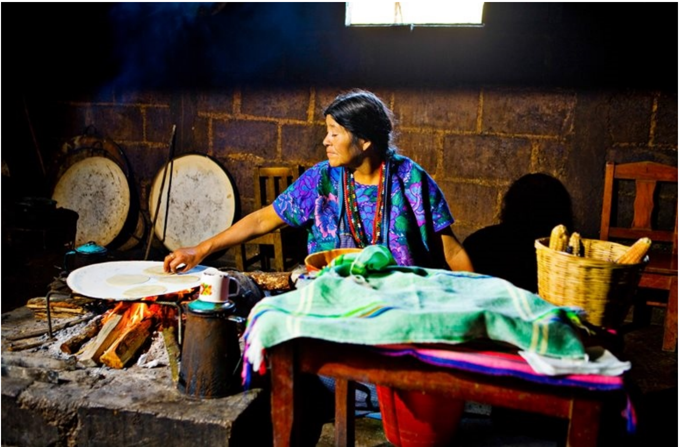
Et kig ind i tortillabageriet