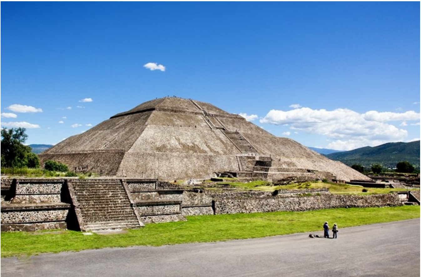
Solpyramiden i Teotihuacán er 65 meter høj