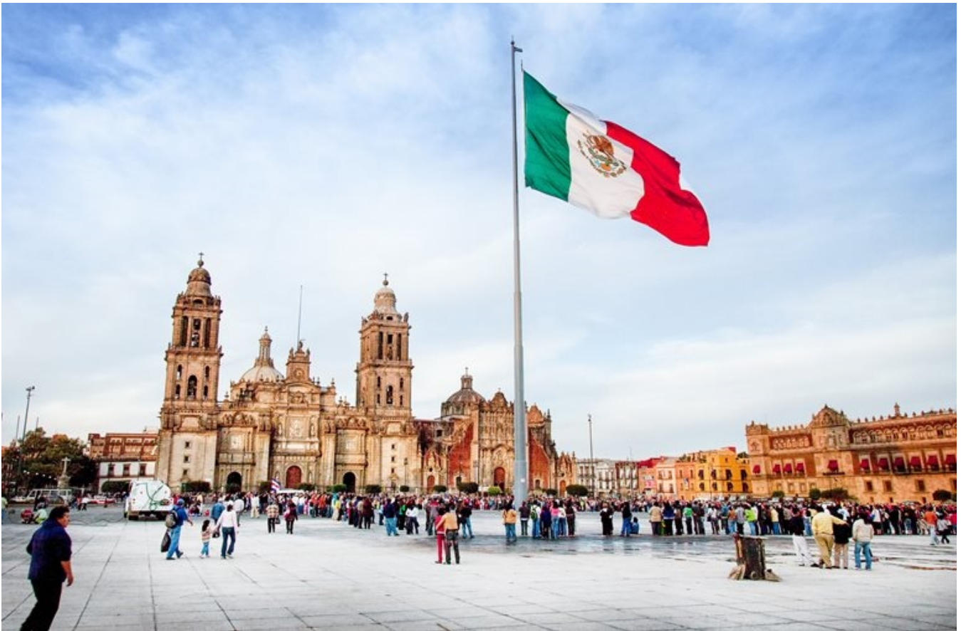
Mexico Citys centrale plads zocalo'en