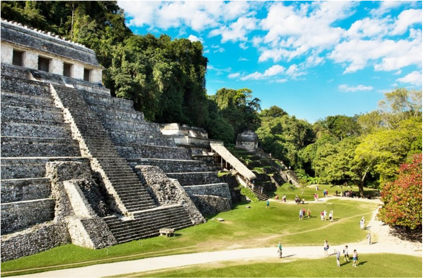
UNESCO-fredede mayaruiner i Palenque

det samme gælder for Månepyramiden, der ligger for enden af den to kilometer lange Avenida de los Muertos – De Dødes