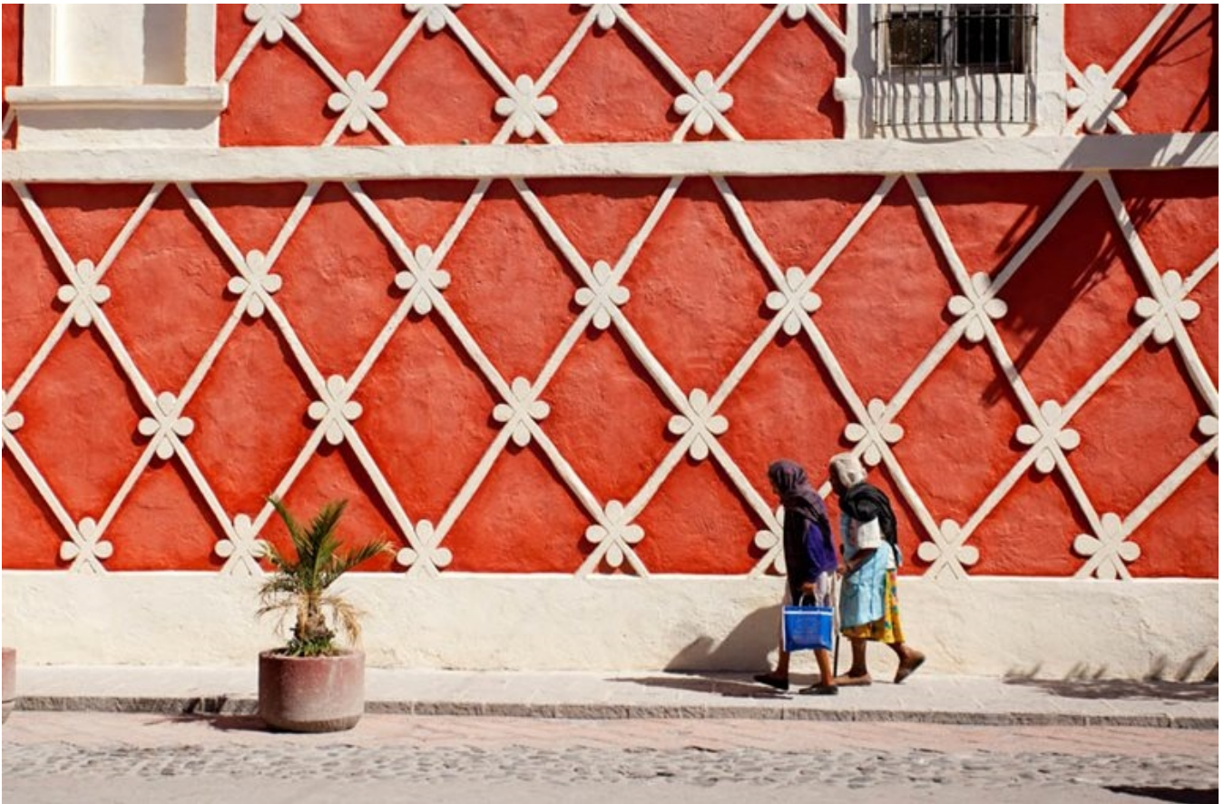
Imponerende facader - man kan føle sig lidt lille