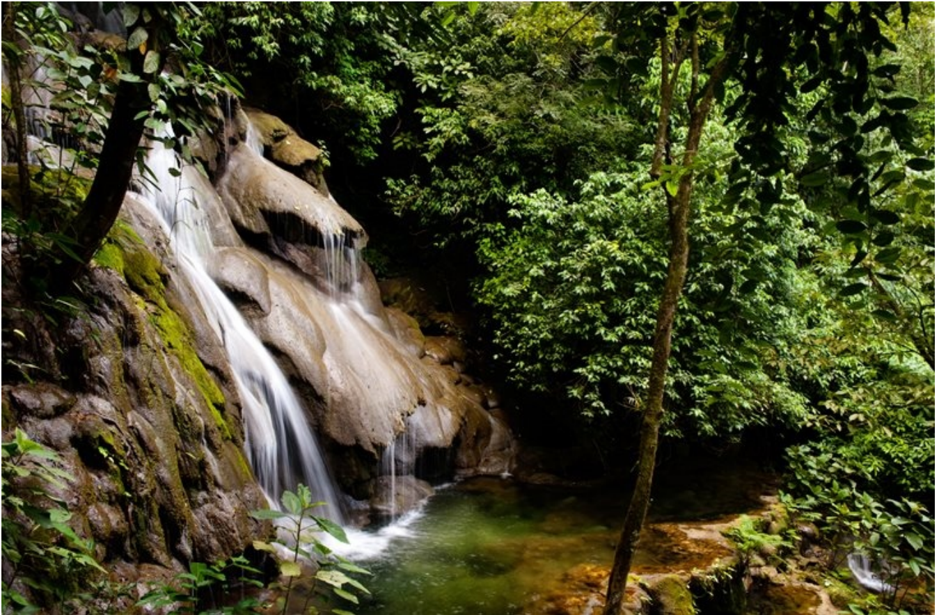
Junglen ved mayaruinerne i Palengue

år 800 e.Kr. På Monte Albán har man fundet mange hieroglyf-lignende tegn, der ligger tæt op ad de mere kendte mayaskrifttegn, samt relieffer af underligt forvredne skikkelser, der i lighed med så meget andet fra Mexicos dunkle fortid fortsat må betragtes som store gåder.