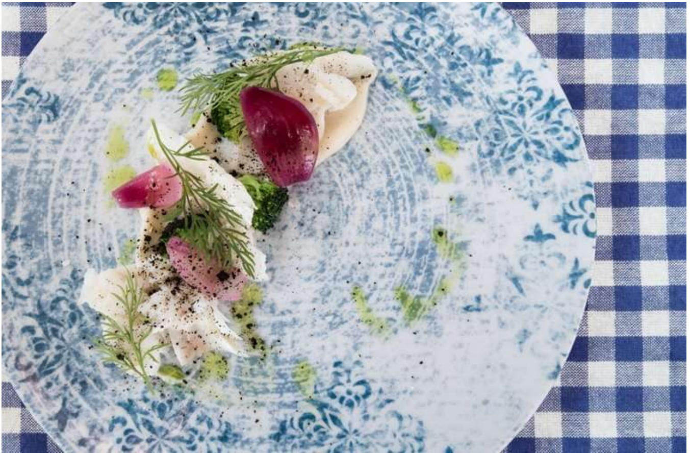
Middag i Restaurant Roklubben