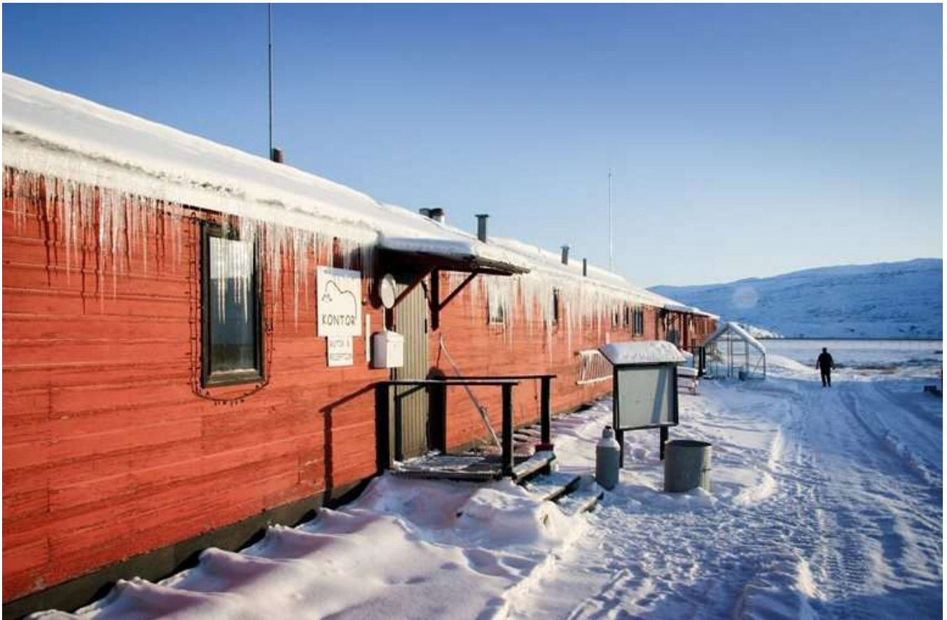
Det hyggelige vandrerhjem Old Camp i Kangerlussuaq

på lidt lokale specialiteter. Vi kommer ikke til at gå sultne hjem. Besøget inkluderer også foredraget "Grønland før og nu" på det lokale museum.