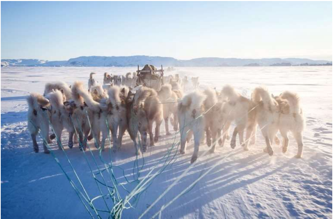
Slædehunden har lært at lystre førerens pisk og kommandoer

landskab høres kun de rolige lyde af knirkende sne, halsende hunde og slædeførerens små ordrer. En uforglemmelig oplevelse!! Tilbage på vandrehjemmet vil der være smør-selv-frokost.