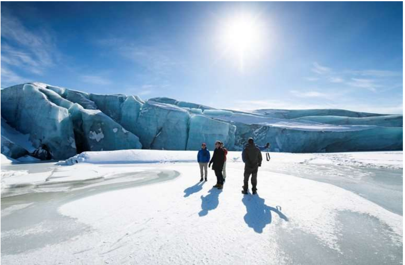
Russellgletsjerfronten rejser sig op til 60 meter i højden