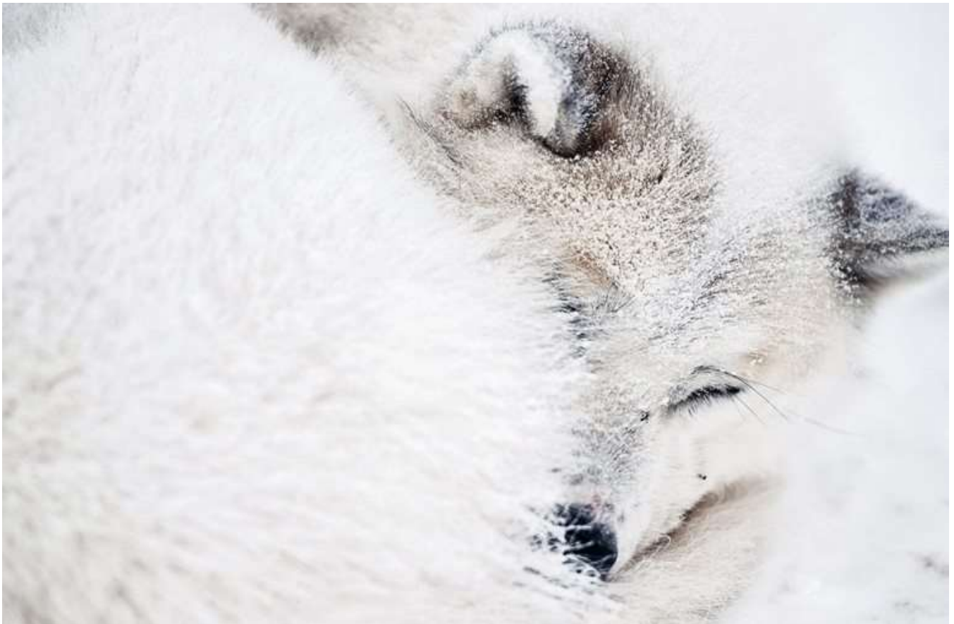
Den typiske slædehund er hårdfør og udholdende