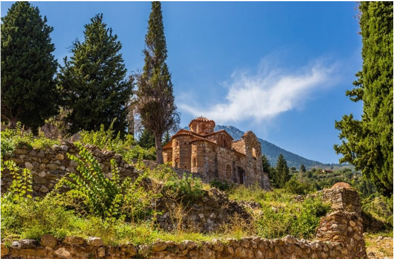
Byzantinsk kirke i Mystras

I dag skal vi om på den anden side af bjerget til byen Nafplio, som er en meget smuk by. Den var fra 1829-31 hovedstad i Grækenland for en kort periode. Her ser vi rester fra den byzantinske, den venezianske og den ottomanske periode. Ude i havet ligger et lille fort, Burtzi, bygget af venezianerne, og over byen knejser på en ca. 200 meter høj klippe et fantastisk veneziansk bygningsværk, Palamidi-fæstningen, hvortil en trappe på næsten tusind trin fører op. Fæstningen blev omkring år 1700 bygget til at forsvare byen mod fjender fra havet. Yderligere er der ruiner fra et knap så velbevaret fæstningsanlæg fra den østromerske og byzantinske periode, Akronafplio.