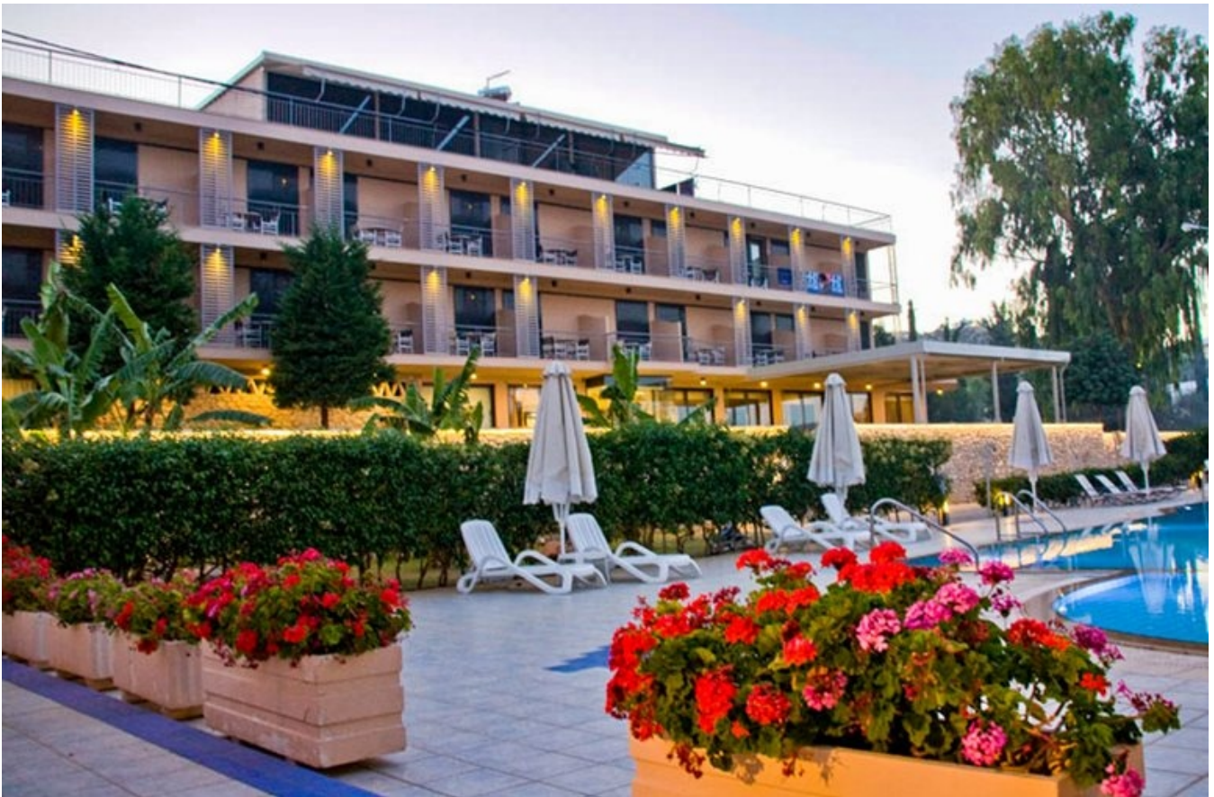
Apollon Hotel's lækre pool!

ikke langt til den herlige strand, der venter med varmt og roligt vand. På hotellet har vi inkluderet halvpension med dejlig morgenmad, og om aftenen spiser vi god græsk veltillavet mad.