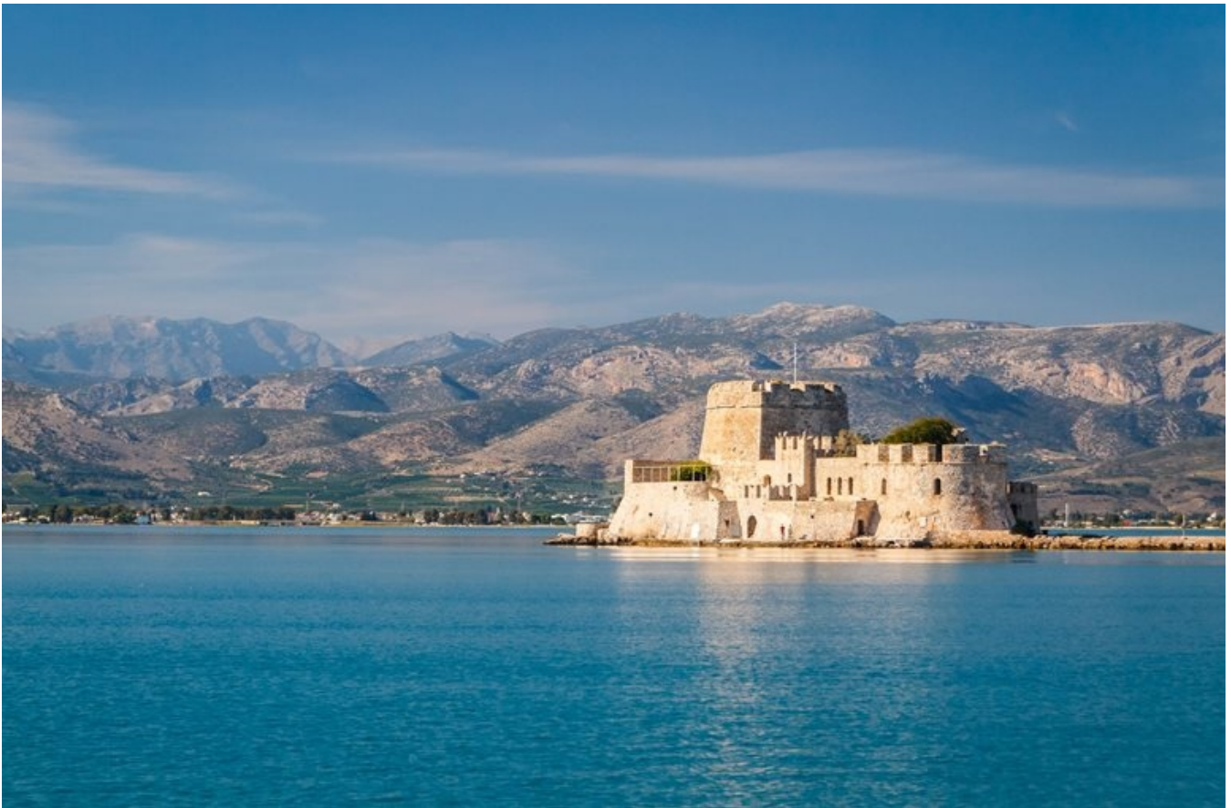
Grækenlands hovedstad fra 1829-31, Nafplio.

tid til at nyde den dejlige by lidt for sig selv, inden vi om eftermiddagen kører tilbage til Tolo igen.