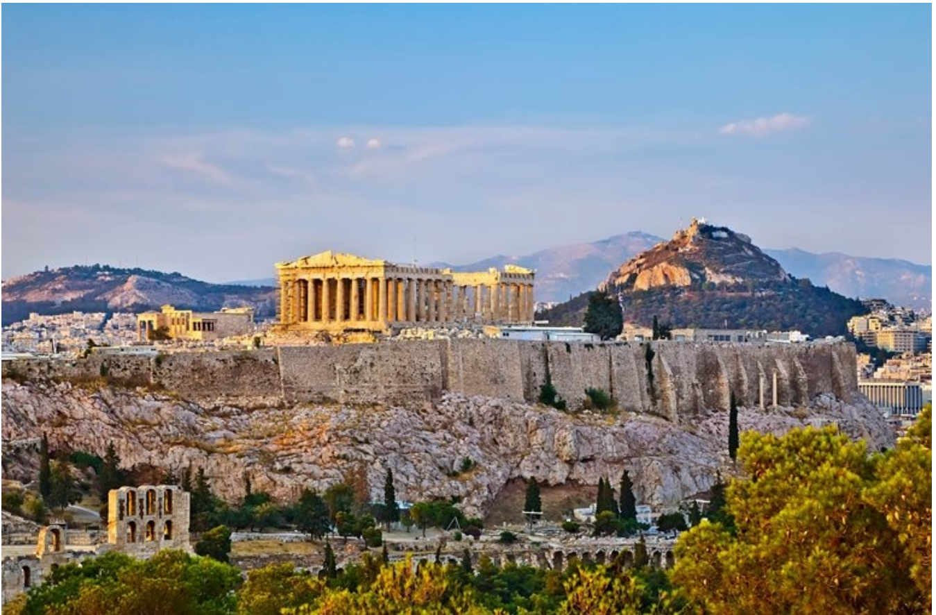
"Middelhavets perle" Athen