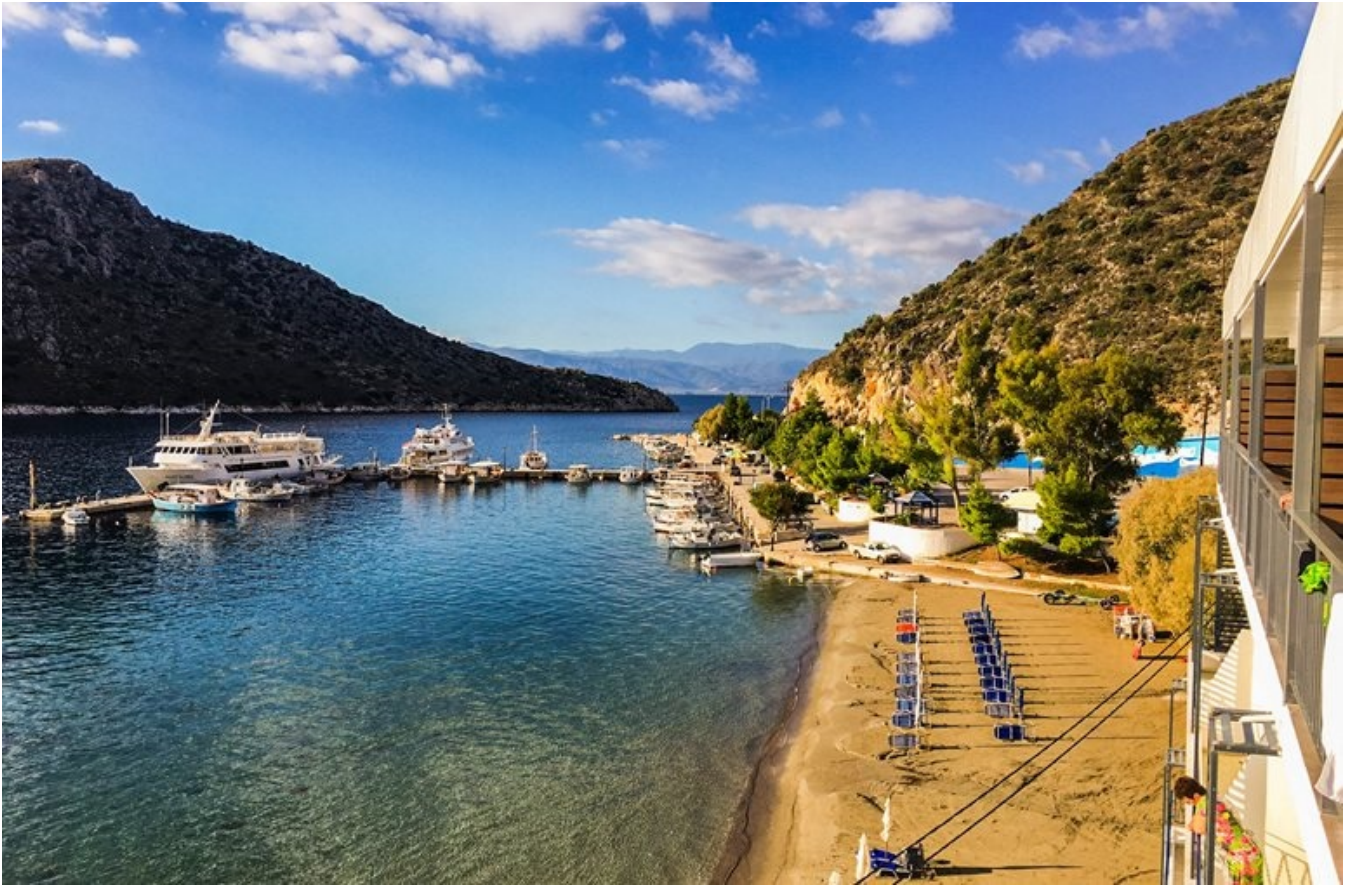
Alt ånder fred og ro i den lille fiskerby Tolo