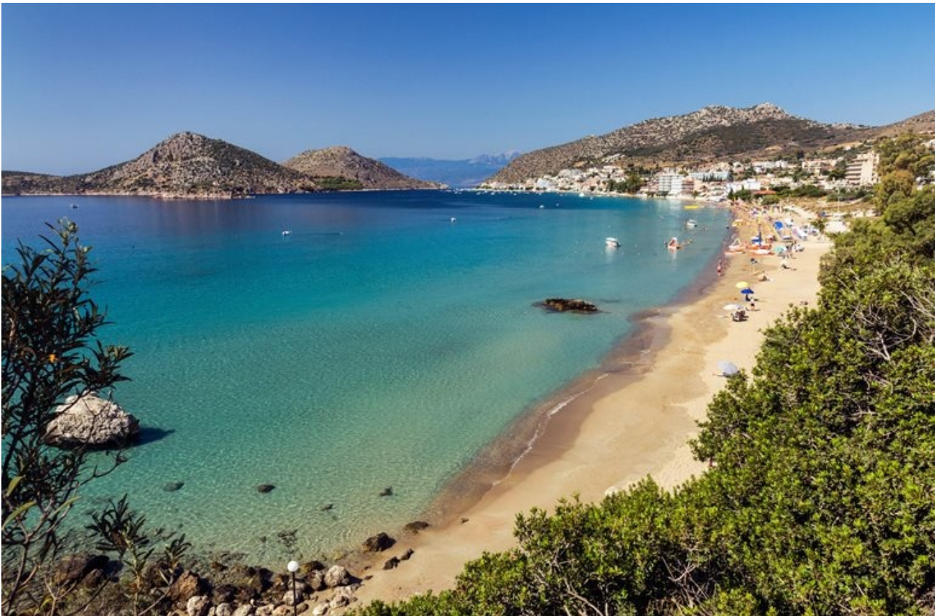
Idyliske Tolo ved havet

været et andet på Peloponnes. Det berømte og imponerende teater i Epidauros ligger i sammenligning diskret og hengemt, men når man kommer tæt på, imponeres man, måske endnu mere, ved at finde et så storslået byggeri midt ude i den græske natur. Stedet var faktisk så uvejsomt beliggende, at det ikke er mere end godt hundrede år siden, at det blev udgravet. Teateret er, som det er tradition for de græske teatre, bygget ind i det omkringliggende terræn, omgivet af duftende pinjetræer, og lange rækker af oliventræer, hvis krogede stammer får en til at tro, at de har stået der ligeså længe som teateret selv.